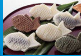
【出店予定】 カメラバル komaru ケータリングキッチンカー-dimple 新郷屋 Merienda