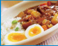
博進堂にて提供! (イメージ)