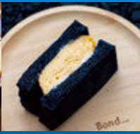
吉川鉄工所隣 Bond...にて提供!